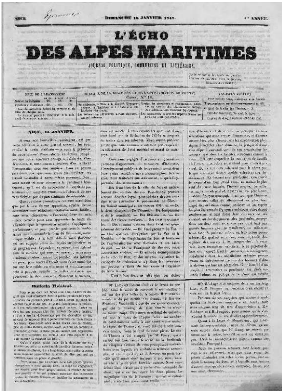
Figure 1. Le premier numéro de L'Écho des Alpes Maritimes , 16 janvier 1848